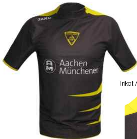
Trikot Alemannia Aachen