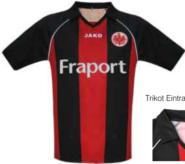
Trikot Eintracht Frankfurt