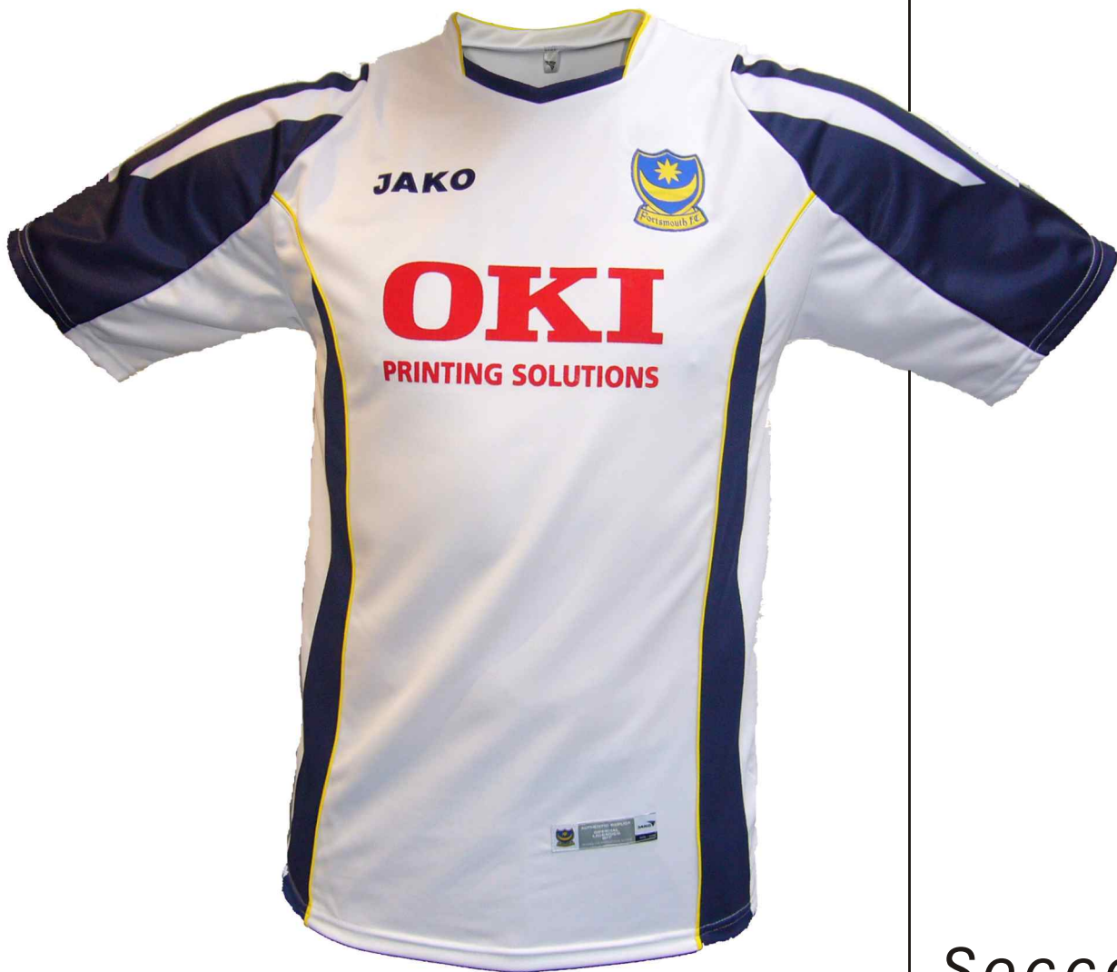
Trikot FC Portsmouth away