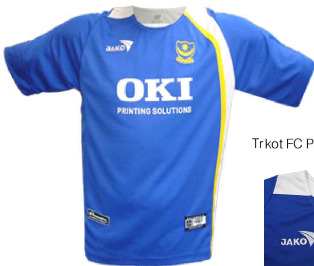
Trkot FC Portsmouth home