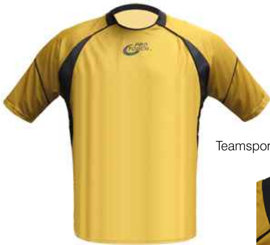
Teamsport Trikot Arsenal