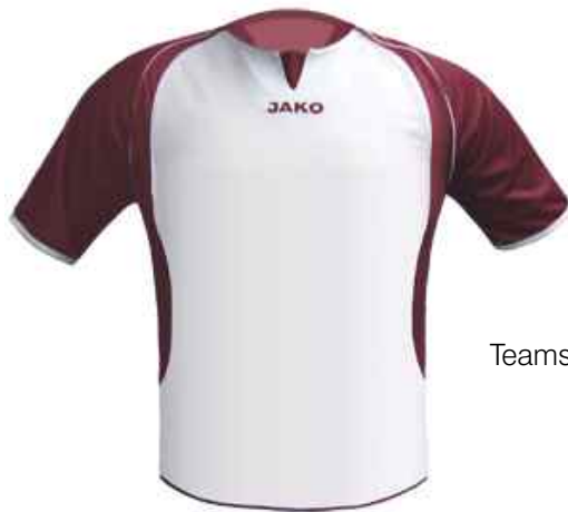
Teamsport Trikot Lazio