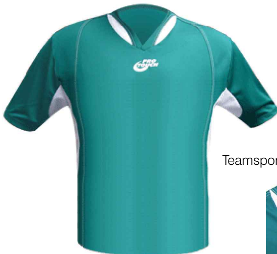
Teamsport Trikot Real