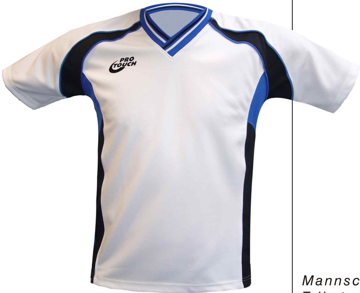
Teamsport Trikot Rosario